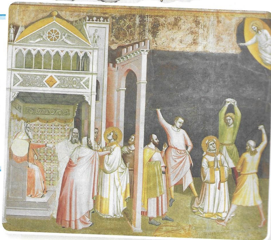
Bernardo Daddi, Martirio di Santo Stefano . Firenze, Basilica di Santa Croce.

Martire deriva dal greco e significa «testimone».